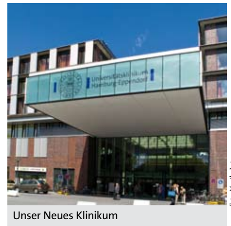
Unser Neues Klinikum

Lesen Sie außerdem, wie das International Office am UKE die Behandlung von jährlich rund 500 Patienten aus aller Welt koordiniert – und wie das Altonaer