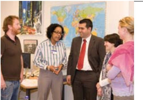
International Office: jährlich 500 Patienten aus aller Welt