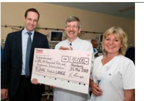
Freunde & Förderer: Spende für die Neonatologie und Pädiatrische Intensivmedizin der Klinik für Kinder- und Jugendmedizin