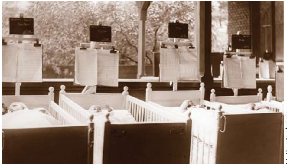
Historisches Foto aus dem Altonaer Kinderkrankenhaus (um 1900)