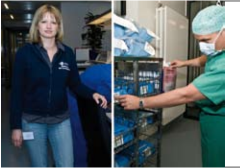
Task Force-AGs: möglichst schnell Abhilfe schaffen