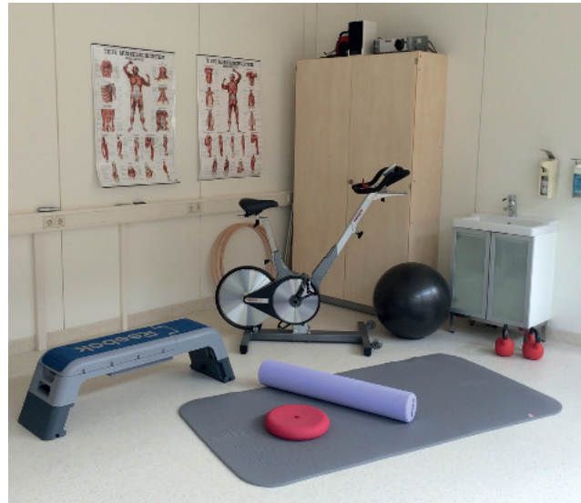
Neuropsychologische Untersuchungen: Haus W26 Sportmedizinische Untersuchungen: Haus O57 Trainingsraum: Haus O56